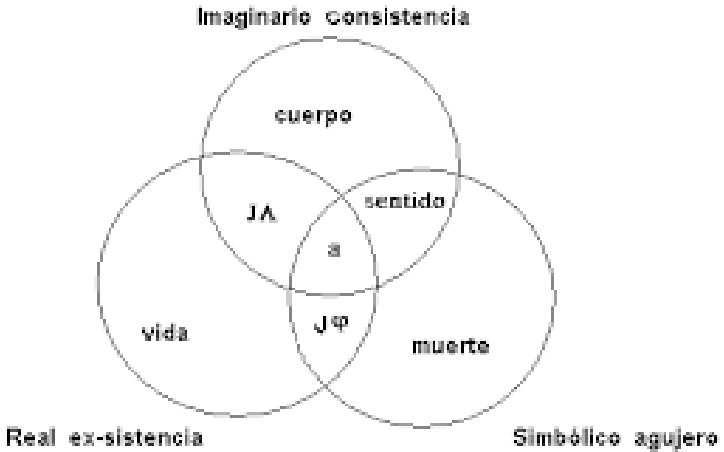
Figura 1. Esta figura representa el nudo borromeo R.S.I.

El objeto a que aparece entre lo real, simbólico e imaginario, señala y encubre el vacío, el objeto a no es un objeto en sí, es más bien una función que señala el vacío. El sujeto y su historia subjetiva se organizan alrededor de ese vacío y el objeto a . En un primer momento, a través de las repeticiones de la demanda nunca satisfecha, se conforman bucles, que se renuevan para bordear un vacío, lo cual para el psicoanálisis lacaniano se denomina toro. El toro es un adentro hecho del afuera como se muestra en la figura 2.